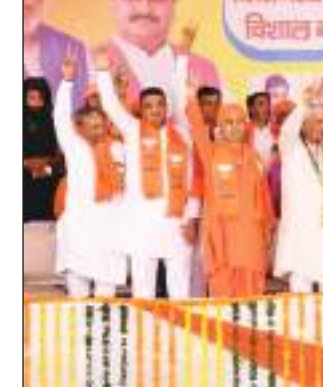
अयोध्या में रामलला का भव्य मंदिर बन रहा है। अयोध्या में आज विकास की बयार बह रही है। एक तरफ सरदार पटेल देश को एक सूत्र में पिरोने का कार्य कर रहे थे तो वहीं कांग्रेस ने कश्मीर में धारा 370 की समस्या पैदा कर दी, जिसे हमेशा के लिए हटाकर प्रधानमंत्री नरेन्द्र मोदी ने अंतिम कील ठोक दी है। कांग्रेस को काम 70 साल में

टीम एक्शन इंडिया/अलवर देश की हर समस्या का नाम कांग्रेस है। इसकी सोच तालिबानी है, जिसने भक्ति और शक्ति की धरती राजस्थान की परंपराओं को कलंकित करने का काम किया है। ऐसी तालिबानी सोच का इलाज बजरंगबली की गदा ही है, इसका उदाहरण इजराइल की गाजा में चल रही कार्रवाई में दिख रहा है, जहां चुन-चुनकर आतंकियों को मारा जा रहा है। ये बातें उत्तर प्रदेश के मुख्यमंत्री योगी आदित्यनाथ ने यहां तिजारा विधानसभा क्षेत्र से बीजेपी प्रत्याशी योगी बालकनाथ के समर्थन में आयोजित एक जनसभा के दौरान कही। आतंकवाद के ताबूत में मोदी-शाह ने ठोक दी है अंतिम कील: उन्होंने कहा कि देश की हर समस्या की जड़ कांग्रेस है। कांग्रेस राज होता तो कभी भी राममंदिर मामले का समाधान नहीं होता। मगर प्रधानमंत्री के नेतृत्व में आज