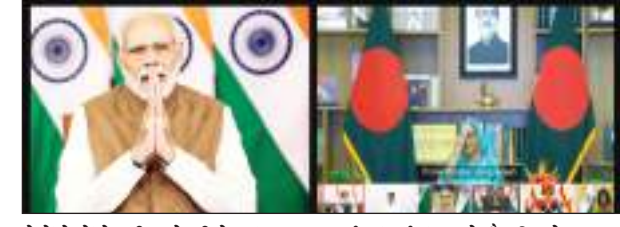
दोनों देशों के बीच दोस्ती के बंधन को मजबूत करने की आपकी प्रतिबद्धता के लिए आभार व्यक्त करती हूँ। भारत और बांग्लादेश के बीच तीन विकास परियोजनाओं के उद्घाटन पर पीएम नरेन्द्र मोदी ने कहा, यह खुशी की बात है कि एक बार फिर हम भारत-बांग्लादेश सहयोग की सफलता का जश्न मनाने के लिए जुड़े हैं। हमारे रिश्ते लगातार नई ऊंचाईयों छू रहे हैं। पिछले 9 वर्षों में हमने मिलकर जो काम किया है, वह इससे पहले के दशकों में भी नहीं हुआ था। भारत और बांग्लादेश के बीच तीन विकास परियोजनाओं के उद्घाटन पर पीएम नरेन्द्र मोदी ने कहा, सीमा पर शांति, सुरक्षा और स्थिरता स्थापित करने के लिए हमने दशकों से लंबित भूमि सीमा समझौते पर हस्ताक्षर किए।

टीम एक्शन इंडिया/नई दिल्ली प्रधानमंत्री नरेन्द्र मोदी और बांग्लादेश की प्रधानमंत्री शेख हसीना ने संयुक्त रूप से वीडियो कॉन्फ्रेंसिंग के माध्यम से तीन भारतीय सहायता प्राप्त विकास परियोजनाओं का उद्घाटन किया। 3 परियोजनाओं का हुआ उद्घाटन: जानकारी के लिए बता दें कि तीन परियोजनाएं हैं अखौरा-अमरतला क्रॉस-बॉर्डर रेल लिंक, खुलना-मोंगला पोर्ट रेल लाइन और बांग्लादेश के रामपाल में मैत्री सुपर थर्मल पावर प्लांट की यूनिट - भारत और बांग्लादेश के बीच तीन विकास परियोजनाओं के उद्घाटन पर पीएम नरेन्द्र मोदी ने कहा, यह खुशी की बात है कि एक बार फिर हम भारत-बांग्लादेश सहयोग की सफलता का जश्न मनाने के लिए जुड़े हैं। हमारे रिश्ते लगातार