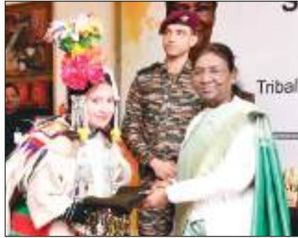
राष्ट्रपति द्रोपदी मुर्मू ने कहा कि लड़ाई में आध्यात्मिक, एडवेंचर, इको और स्वास्थ्य पर्यटन से जुड़ी अपार संभावनाएं हैं।